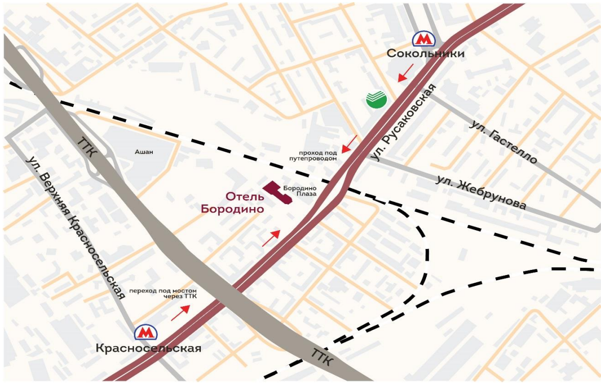
Схема проезда на парковку